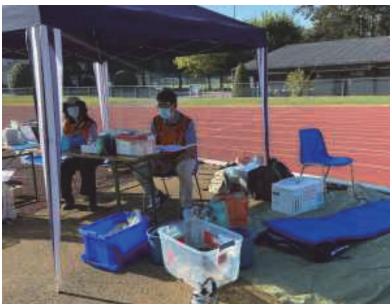
← 医師の医療ボランティア