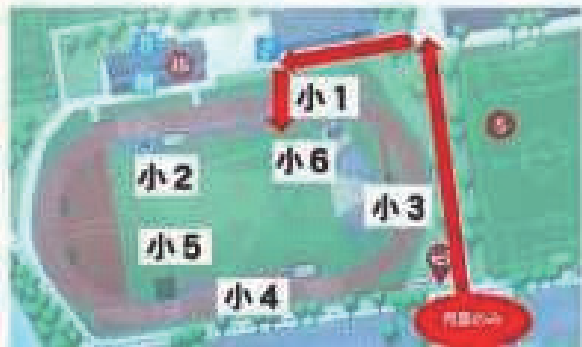
↑ グランドの各学年パビリオの場所