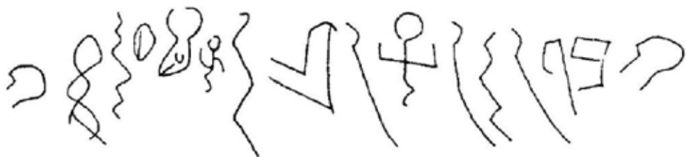
図3 ワディエルホルで発見された碑文より