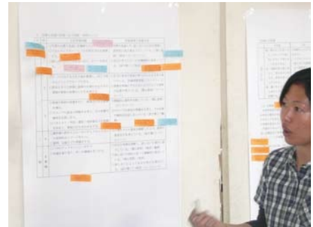
ワークショップによる授業研究会

全教職員が「チーム」として立案した指導案だけに、授業後の反省会は、課題などを自分自身のものとして捉え、学校全体の指導力向上を目指した研究であることを実感させてくれた。