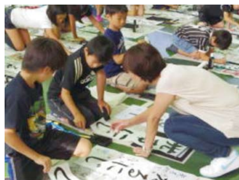
校内書初め会の指導をするボランティア