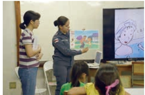
現地警察官による講話

本校では、現地で生活する日本文化コースの児童生徒も通学している。それだけに現地で生活する児童生徒にとっても、『自分の身は自分で守る』ことを意識させる必要がある。また、マナウス市では子どもを狙った事件や強姦（2015年統計 人口10万人単位で日本の約35倍の発生）も多発しているだけに、現地警察官からマナウス市で発生している事件の概要、それらからの身の守り方を学ぶことは児童生徒にとっても大いに参考になる。