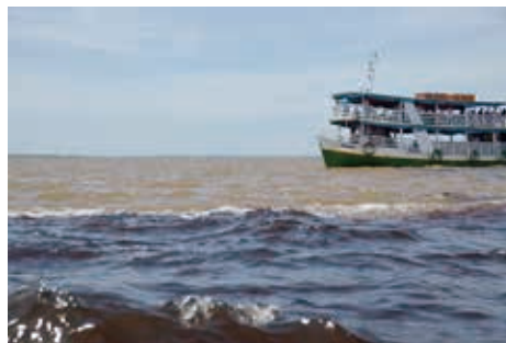
アマゾン川合流地点

マナウス市はアマゾンの中流、ネグロ川、ソリモンエス川との合流地点の15km手前、南緯3度8分、西経60度1分の地点に位置している。この町は17世紀にポルトガル人がアンデス山脈を越えて侵入してくるスペイン人の侵略を防ぐために、ネグロ川左岸に要塞を建設したのが起源である。18世紀に入ると、カカオ、コーヒー、ナッツ、タバコなどの採集産業が盛んになり、その集積地として発展し、「マナウス村」と呼ばれるようになった。19世紀に入り市に昇格し、その後、1889年アマゾナス州の制定に伴い州都となった。