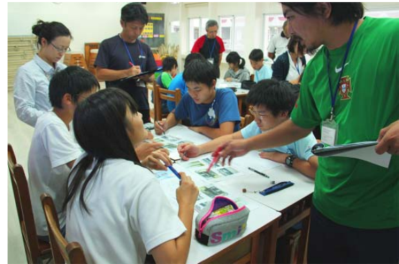
異学年集団による学びあいの様子

各教科での取り組みという反省を生かし26年度は5教科の各担任教員が分担し1時間(50分)の授業を提案することとなった。その際、週に一度行われる中学部会内で約2週間を目途に取り上げる教材についての事前研修を行い、目標の確認と指導案の流れについて学部の教員が額を寄せ合い活発な意見交流を深めた。このことによって、各教科の特性を活かした取組を行えるようになり、連続型・非連続型の読解力をバランス良く学習できるようになったのではなかろうか。また、教科を異にする教師同士の積極的な意見交換が活発になり各教科のアプローチの良さを学びあえるとともに、日常の教科に還元できたことが大きな成果といえよう。