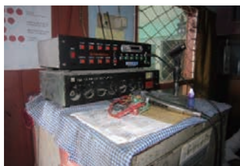
緊急時に使う放送器具

「非常時の際にはどのように子どもたちに情報を伝えるのか」という質問に対して、全体に伝わる放送機器があるので、それを使って伝え1か所に集めるということだった。また、けがの際には救急箱が常備されており、速やかに対応ができるような設備が整っていた。また、学校の敷地の周りには高い塀で敷き詰められており、外部からの侵入をさせない建物となっているので、このような体制でも十分なのだと感じた。「安全マニュアルはあるのか」という質問に対しては、そういうものは現時点で作成しておらず、非常時には保護者にメールで一斉送信して伝えられる体制が整っており、この連絡手段に関しては、行事のお知らせ等で日ごろから活用しているとのことで、連絡系統はしっかりしていることがわかった。