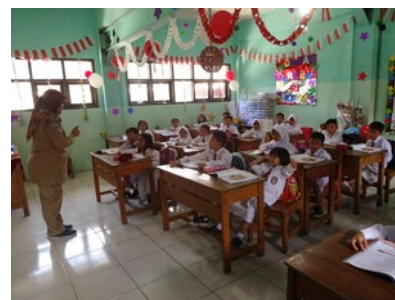
現地校の授業の様子

教育体系は、国家教育省が管理する一般の学校～スコラと、宗教省の管轄となるイスラム系の学校～マドラサ、プサントレンがある。いずれも小学校・中学校・高校・(大学)の6・3・3・4制であり、このうち小中学校の9年間については義務教育である。スコラでもマドラサ、プサントレンでも、一般科目と宗教科目を履修することとなっているが、マドラサ、プサントレンは特に宗教を重視した教育を行い、小・中学校から全寮制のところも多い。就学率は小学校約93%に対し、中学校は約80%であり、特に地方ではまだまだ低い現状である。