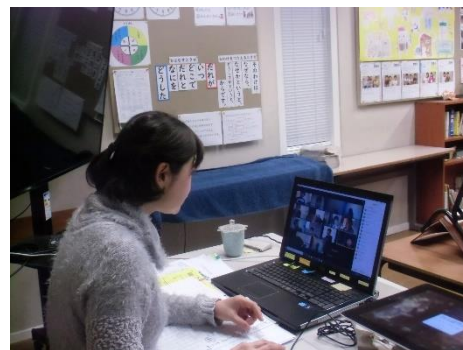
図2 オンライン授業の様子

オランダ政府の発表を元に、理事会やPTAと話し合い、4月21日(火)から授業を開始することにした。教職員には、初めてのことで、うまくいかなくてもゆっくりと進めていけばよいということを伝えた。失敗してもよいという安心感を持たせることで、取り組みやすくしていった。始めは手探りで進めていったが、次第に、分かったことはその日の放課後の終会で、分かった職員が、終会中に発表して、他の職員に教えることで全体のレベルアップが図れた。所謂、ボトムアップ研修を実施することができた。