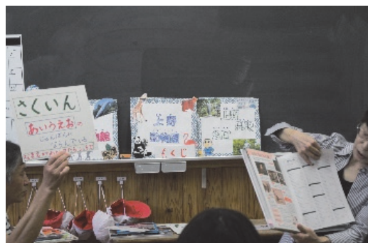
写真1 学校司書による本の調べ方の紹介

聞かせを中心とした物語の場面の理解や言葉の発達を促すなどの取り組みを通して、好きな本ができるように子供の反応を見ながら実践してきた。また、学校司書は、給食等のちょっとした時間を有効活用し、児童の生活上の課題や実態をつかみ、必要とされる時に絵本の読み聞かせ等に繋げて関わった。