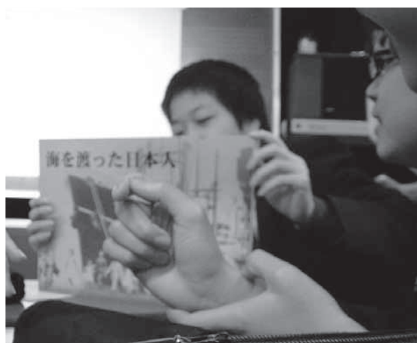
サンノゼ太鼓（上）と移民を知るための紙芝居（下）