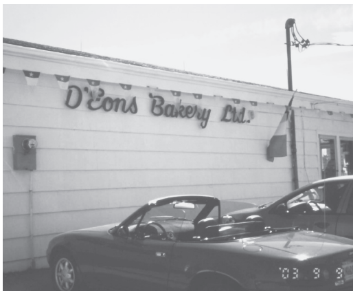
写真9 ヤーマス・カウンティ、ウェスト・ピュブニコにおける店舗