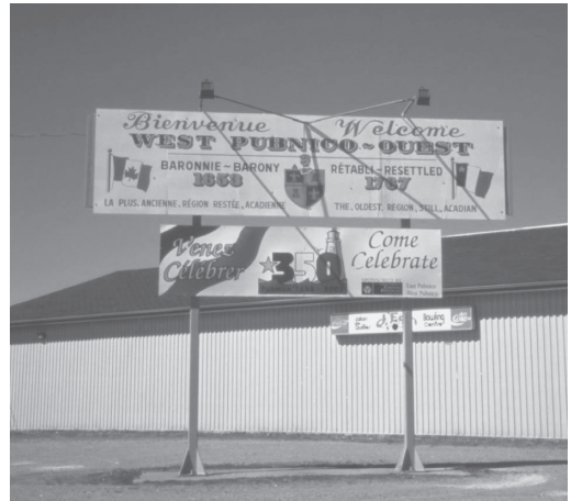
写真3 東西南北を含む地名の表記

フランス語でピュブニコ・ウエスト (Pubnico-Ouest)、英語でウェスト・ピュブニコ (West Pubnico) と称され、形容詞の用い方の違いをいかした表記がなされている。このコミュニティは、ノヴァスコシア州に現存するフランス語系コミュニティのなかで、1755年の追放以前にフランス人入植者が住んでいた数少ない例の一つで、1653年に男爵領となり、1767年に再定住を果たしたことが記されている。