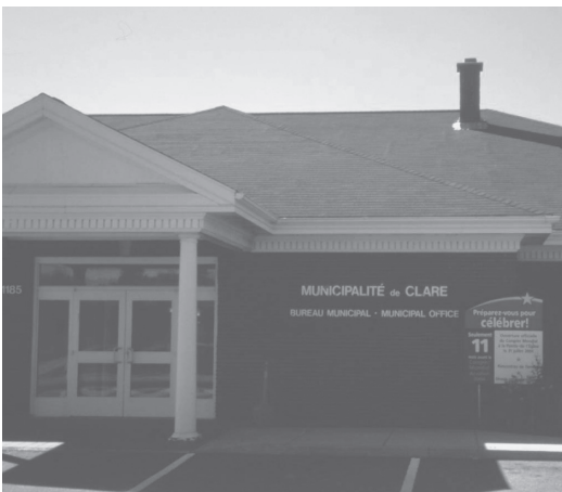
写真4 クレア行政区の役場

中央に大きくフランス語で「クレア行政区」と書かれ、その下にフランス語と英語で役場であることが記されている。