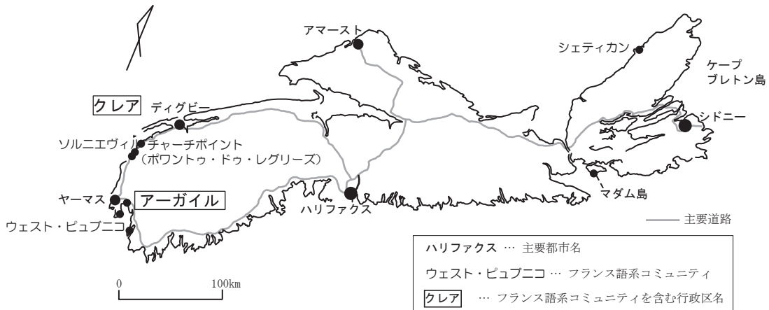
第1図 ノヴァスコシア州の主要都市とフランス語系コミュニティの位置