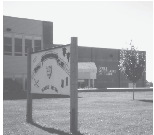
写真5 クレア中等学校