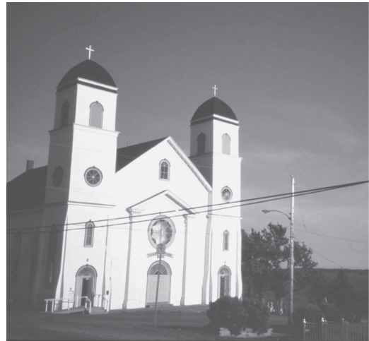
写真1 マダム島、アリシャのカトリック教会

ノヴァスコシア州本土とケープブレトン島との間の海峡にあるマダム島の中心集落アリシャには、1844年から1880年までカトリック教会の司教座がおかれていた。尖塔形式のカトリック教会が目立つ大西洋カナダでは珍しいスタイルである。