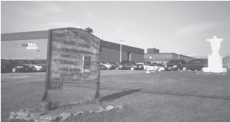
写真6 ミサの時刻を示すカトリック教会の看板

この看板では一番下にみえる WELCOME の表記以外はすべてフランス語で記されている。後ろに見える建物は学校である。