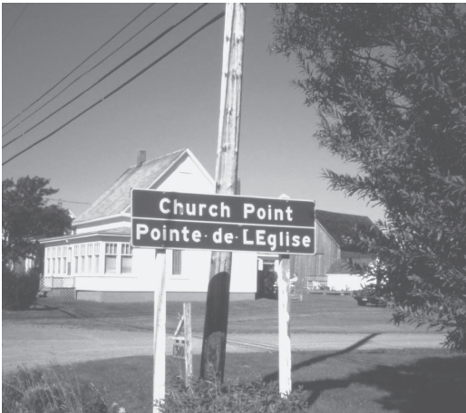
写真2 二つの言語で書かれた地名

かつては英語の地名のみが地図に示されていたが、二言語主義の浸透により、最近では二言語併記が一般的となっている。