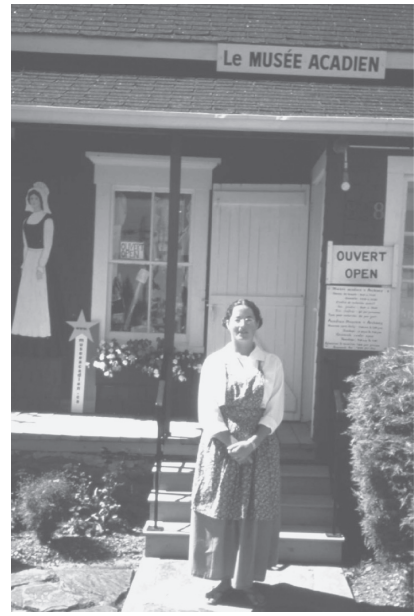
写真8 ウェスト・ピュブニコのアカディア博物館と伝統衣装に身を包んだ女性スタッフ