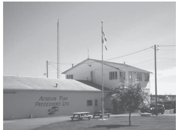
写真10 ヤーマス・カウンティ、ウェスト・ピュブニコにおける水産加工工場

店舗である。d' Eon は、d' Entremont と並んでこの地域のフランス語系住民にみられる典型的な姓の一つであり、オーナーはフランス語話者の可能性が高い。しかも、入り口近くに「三色旗に星」というアカディアンの旗が掲げられていることから、オーナーはアカディアンのア