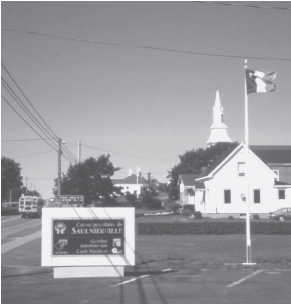
写真7 信用組合の看板

「三色旗に星」のアカディアンの旗がはためき、後ろにカトリック教会の建物が見える。