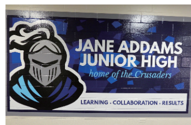
交流相手校のシンボル

訪れた学校に限らず、多くの学校にはその学校を象徴するキャラクターが設定されており、自らの学校に対する帰属意識を強め、自尊心を育むために機能している。多様な価値観を、シンボルを通してひとつにまとめようとする方法は、アメリカという国の姿の一端を象徴している。