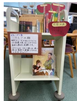
世中版りんごの棚